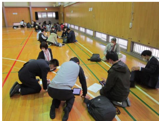
プロジェクト会議